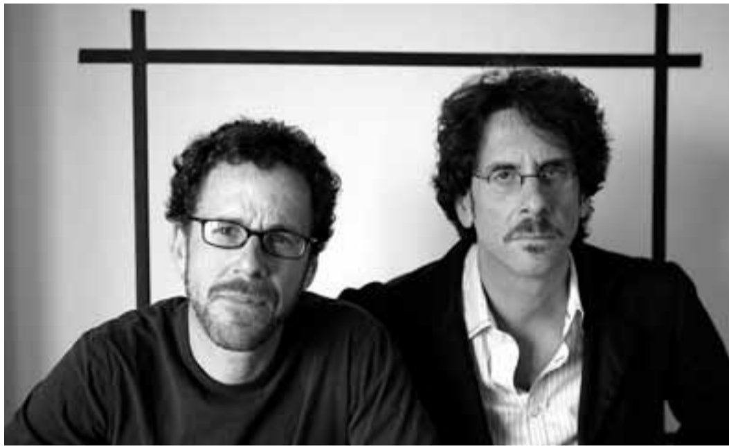
Os irmáns Ethan e Joel Coen.