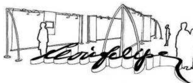
Un boceto que plasma una vista general de la exposición itinerante del poeta de Tábara

«León Felipe. Dudas y Alma» es el título de la exposición itinerante encargada a una empresa zamorana hace más de cuatro años sin que desde entonces ni se haya materializado la iniciativa ni se haya pagado el proyecto aprobado. Ante esta situación, el responsable de la firma reclama retomar la actividad cultural y recibir el pago por el trabajo ejecutado. La muestra itinerante está pensada para divulgar la vida y obra del poeta tabarés a través de los fondos de su legado y con un recorrido por ciudades españolas entre las que figuran Madrid, Santander, Cádiz, Valencia y Barcelona.